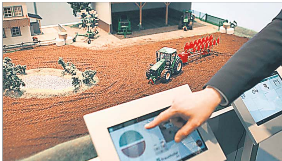
♦ Model elektronicznej kontroli pracy ciągnika wzbudził duże zainteresowanie wśród zwiedzających hanowerskie targi

Minister Philipp Rösler wskazał natomiast na potrzebę bliższej współpracy Polski i Niemiec w obszarze wykorzystywania rozwiązań ICT dla poprawy efektywności energetycznej. – Nowe technologie informatyczne mogą się przyczynić do bardziej racjonalnego wykorzystywania i magazynowania energii – podkreślił. Piechociński poruszył tak-